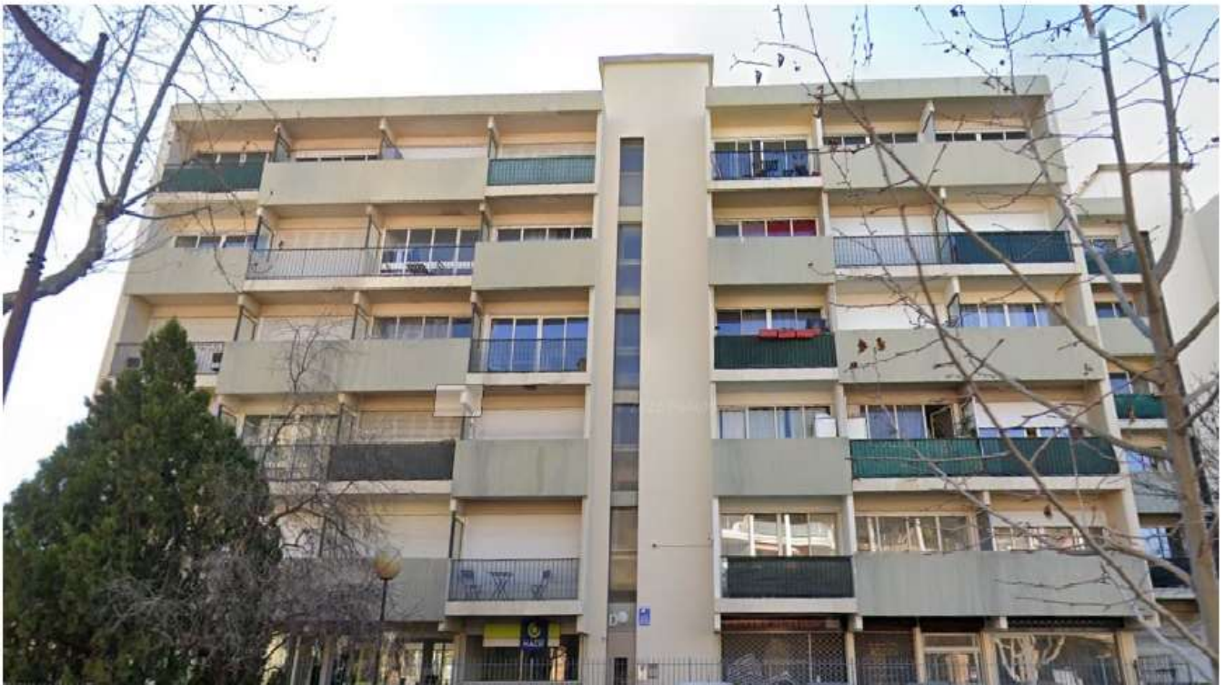
PHOTO DU BIEN